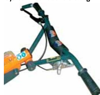
Comfortabele aanpasbare handgreep