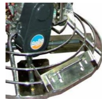
Vlakke afwerking tegen muren