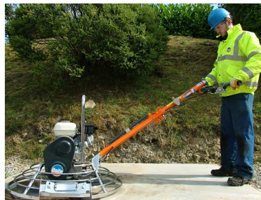
Eenvoudig in gebruik