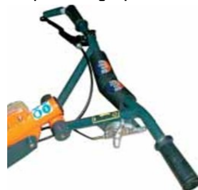
Comfortabele aanpasbare handgreep