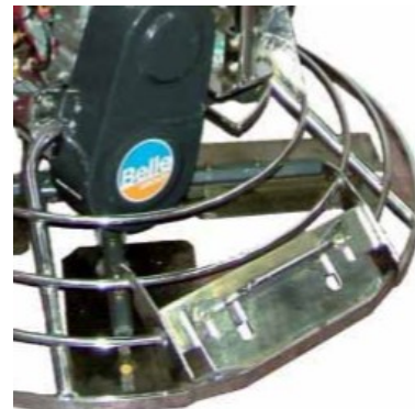
Vlakke afwerking tegen muren